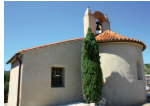
↑ La chapelle romane du hameau de Cosprons, récemment restaurée

Le tourisme vert connaît une demande croissante.