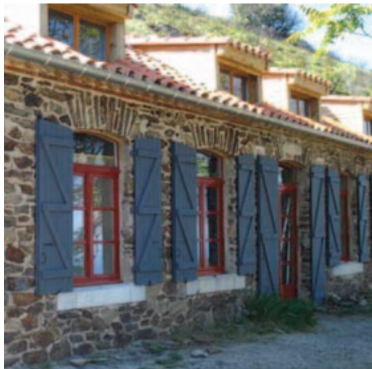
↑ Le refuge Madeloc, nouveau gîte d'étape

La riche histoire militaire de Port-Vendres mérite d'être valorisée. Aussi, la Ville envisage de réhabiliter les fortifications désaffectées afin de leur donner une nouvelle fonction. Ainsi, ces édifices de caractère sont mis à disposition à des fins d'aménagement et de valorisation du patrimoine. Plusieurs activités peuvent y être développées : hébergement, restauration, expositions, manifestations musicales... L'attractivité du territoire et la découverte de l'arrière pays seront ainsi favorisées.