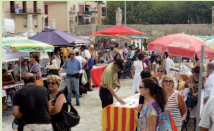
← Forum des associations

La Ville a adopté en 2011 une charte associative qui accompagne le développement du milieu associatif dans le respect de son autonomie et la recherche d'un partenariat constructif. Chaque année, une plaquette des associations est réalisée. Distribuée en Mairie et dans les lieux stratégiques, la plaquette est téléchargeable sur le site internet de la ville : www.port-vendres.com , onglet « Culture/Animation », rubrique « Associations ». Enfin, le forum des associations organisé chaque année, favorise les synergies entre les associations locales.