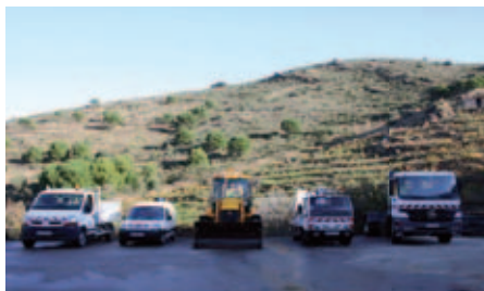
↑ Flotte de véhicules du centre technique municipal

Dans un double souci de suivi des consommations et de limitation des émissions de gaz à effet de serre, la Ville souhaite maîtriser la consommation en carburant du parc des véhicules des Services Techniques.