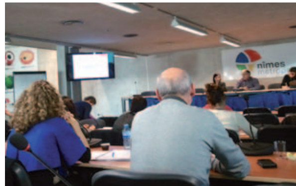
↑ Comité régional des Agendas 21, Communauté d'Agglomération Nîmes-Métropole, 20 novembre 2012

Consciente que la mutualisation des connaissances est bénéfique à l'amélioration continue des pratiques et de son projet de territoire, la Ville assure une veille des réunions, séminaires ou animations liés au développement durable organisés par le département, la région ou d'autres structures. En effet, la mise en œuvre d'un Agenda 21 implique de réunir des savoirs et des compétences multiples et la collectivité mesure l'importance de s'ouvrir aux échanges d'expériences entre différents acteurs. Il s'agit ainsi de participer régulièrement aux rencontres proposées afin d'assurer l'échange de bonnes pratiques.