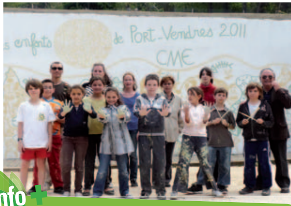
↓ Réalisation de la fresque du Val de Pintes (2011)

La Ville est consciente de l'importance de préparer les jeunes générations à devenir des citoyens actifs. C'est pourquoi un Conseil Municipal d'Enfants (CME) a été créé en 2009. La Ville accompagne ainsi les initiatives des jeunes en les mobilisant collectivement autour de projets transversaux. La démocratie locale est ainsi favorisée. Des thématiques larges sont abordées : solidarité, humanitaire, citoyenneté, environnement, cadre de vie, culture, sport, loisirs, communication. Les activités artistiques et ludiques sont privilégiées par les encadrants. Les actions du CME sont régulièrement relayées dans le bulletin municipal. Il s'agira de poursuivre cette dynamique en y associant des partenaires variés