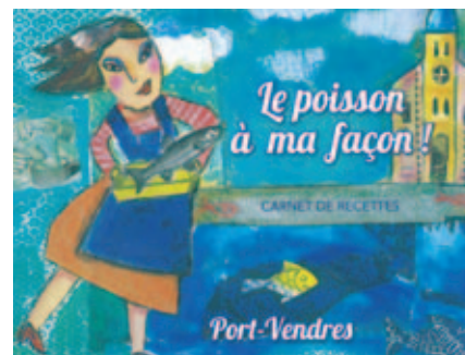
↑ Carnet de recettes en vente à l'Office de Tourisme

Dans une logique de partage de savoir-faire culinaire, Port-Vendres a initié en 2012 un concours de recettes gratuit sur le thème du poisson bleu et blanc. Les habitants de l'ensemble du département ont été invités à faire connaître leur recette originale. Les finalistes ont