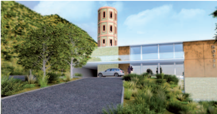
↑ Projet d'hôtel**** au Château Pares

La Ville souhaite optimiser l'accueil des touristes et des randonneurs tout au long de l'année. Pour cela, elle a affirmé sa volonté de voir se réaliser des hôtels de qualité au travers de son PLU. Ainsi, des secteurs préférentiels ont été définis pour implanter trois hôtels. Les secteurs du Coma Sadulle et des Tamarins permettront d'accueillir respectivement un hôtel*** de 50 chambres et une résidence hôtelière**** de 50 unités. Le troisième site est celui du Château Pares, sur le versant Nord du secteur des Tamarins. La Ville a conditionné la vente de ce bien emblématique très vétuste à la réalisation d'un hôtel**** d'une cinquantaine de chambres, avec un espace aquatique et des infrastructures permettant l'organisation de séminaires. De plus, la Ville a souhaité autoriser la création d'une aire naturelle de camping dans l'arrière-pays, entre la baie de Paulilles et le hameau de Cosprons. L'installation des campeurs sur le territoire sera ainsi canalisée.