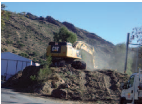
↑ Travaux du Skate parc en cours

En 2012, le Conseil Municipal d'Enfants a proposé de réaliser un Skate parc. La Ville a retenu cette initiative et s'est engagée à respecter au mieux les attentes des jeunes : emplacement du site, choix des modules... Des terrains, rue M. Costesèque, ont été acquis et les travaux programmés.