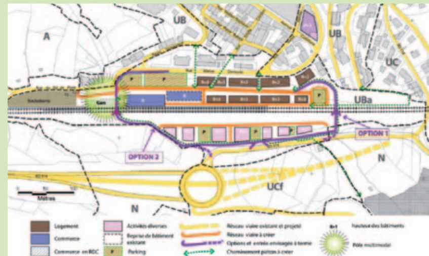
↑ Projet du quartier de la gare, vue d'ensemble

Une étude a été réalisée afin de définir les différents aménagements et d'en optimiser leur mise en place.