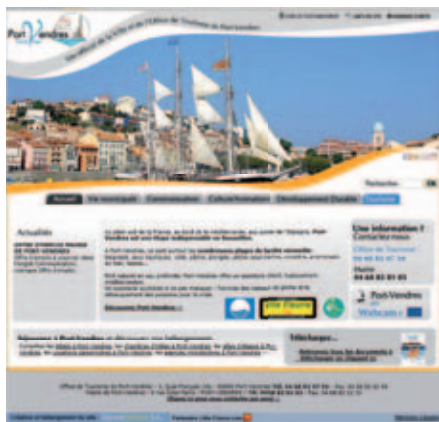
↑ Nouvelle page d'accueil du site internet de la Ville