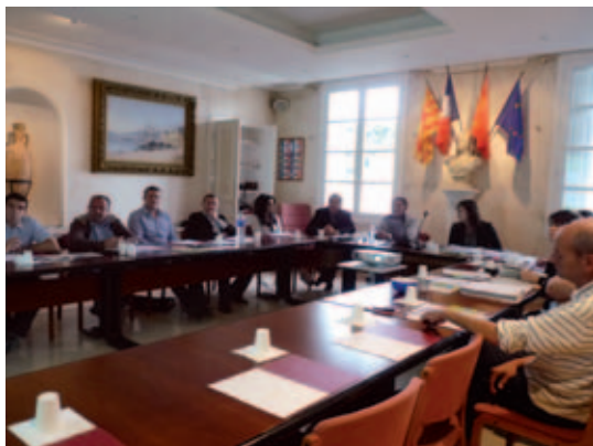
↑ Comité technique du 29 octobre 2013

Poursuivant sa logique ouverte associant différents acteurs dans la construction de son projet de territoire, la Ville s'est donnée les moyens de se doter sur le long terme d'organes participatifs et consultatifs pour assurer le suivi du projet.