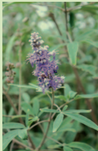
↑ Fleur de Gattilier

Depuis 2012, le bulletin municipal possède une mini rubrique scientifique, « Le saviez-vous ? », qui renseigne sur la faune et la flore locales. Découvrez les richesses naturelles du territoire sur le site internet de la ville : www.port-vendres.com , onglet « Développement durable », rubriques « des paysages d'exception » et « une étonnante richesse biologique ».